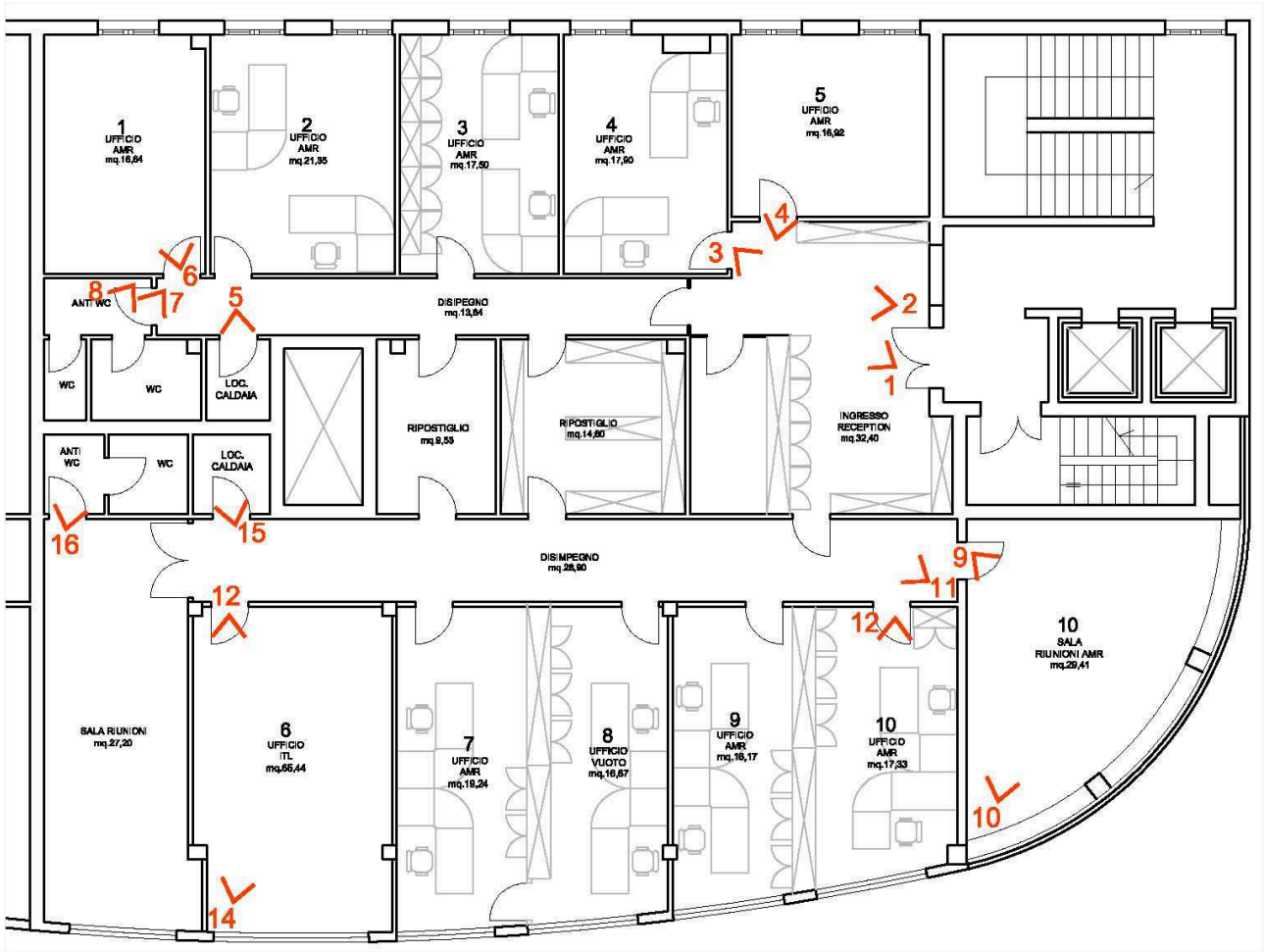
Planimetria di riferimento